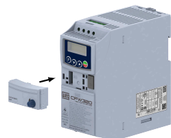
(b) Accessory connection (b) Conexión del accesorio (b) Conexão do acessório

Figure A.1: (a) to (b) Installation of accessory