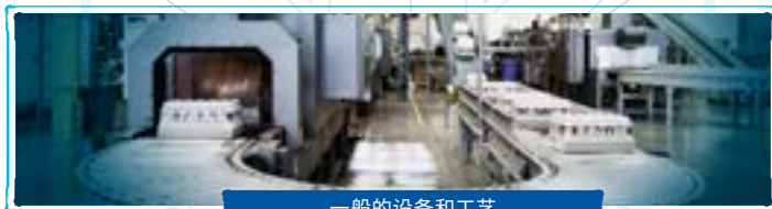
一般的设备和工艺