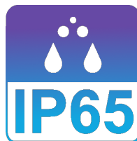
Proteção IP65 Contra poeira e água