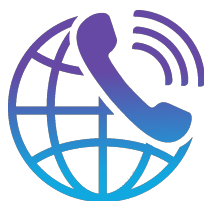
SIP 2.0 e ONVIF