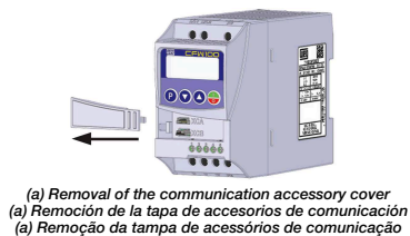
(a) Removal of the communication accessory cover (a) Remoción de la tapa de accesorios de comunicación (a) Remoção da tampa de acessórios de comunicação