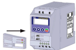
(b) Accessory connection (b) Conexión del accesorio (b) Conexão do acessório