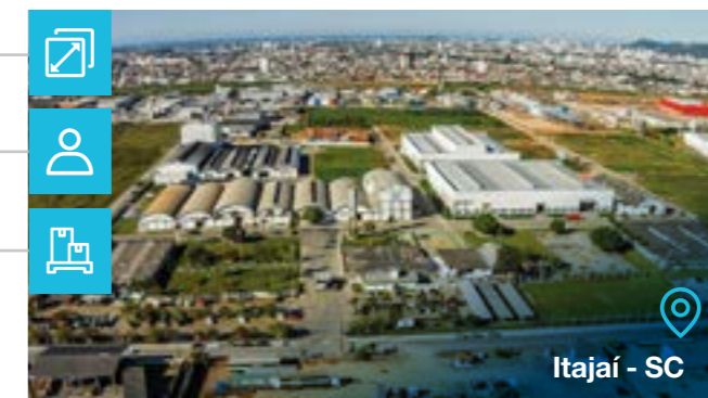
Itajaí - SC

Tipo de negócio: Transformadores a Seco Seccionadores Painéis Salas Elétricas