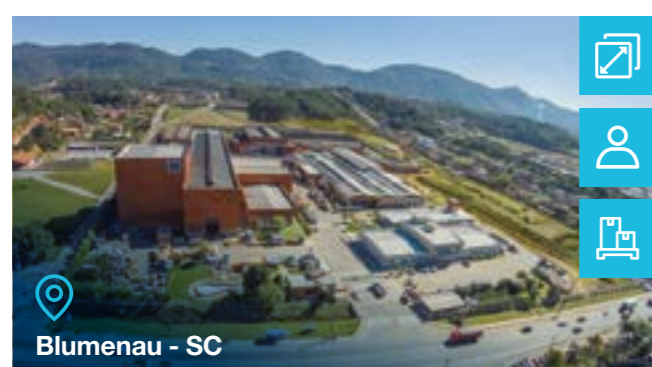
Blumenau - SC

Tipo de negócio: Tintas Industriais Peças em Ferro Fundido para Motores de BT (fundição) Tintas em Pó Vernizes Eletroisolantes