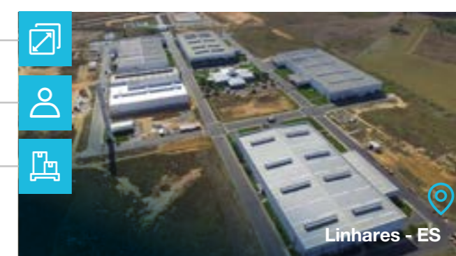
Linhares - ES

Tipo de negócio: ■ Tintas ■ Vernizes ■ Esmaltes ■ Lacas