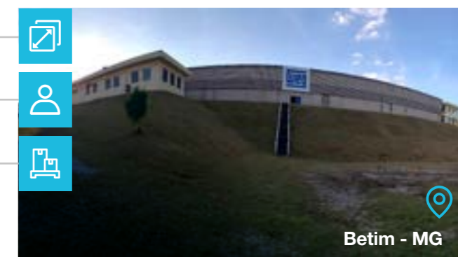
Betim - MG

Tipo de negócio: ■ Motorreductores ■ Redutores