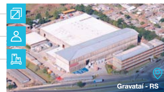
Gravataí - RS

Tipo de negócio: Transformadores de Potência