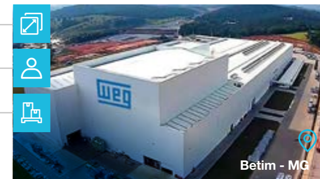
Betim - MG

Tipo de negócio: ■ Segurança & Sensores ■ Serviços