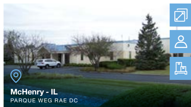
McHenry - IL PARQUE WEG RAE DC