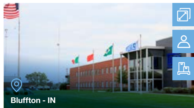
Bluffton - IN