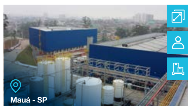
Mauá - SP

Tipo de negócio: ■ Transformadores de Instrumentação