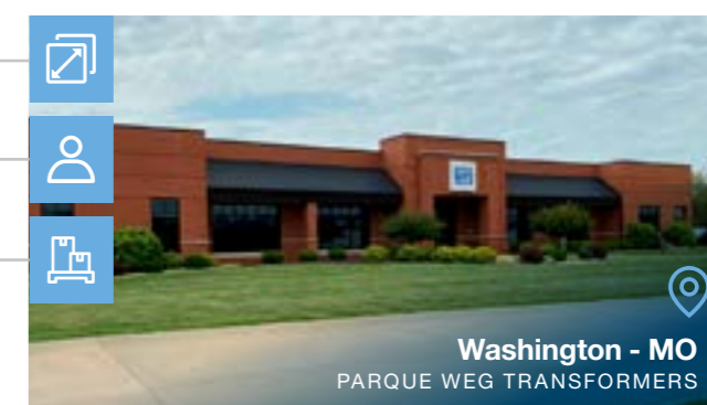
Washington - MO PARQUE WEG TRANSFORMERS