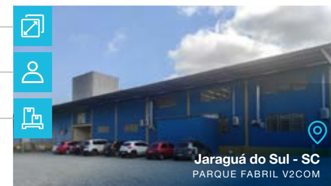
Jaraguá do Sul - SC PARQUE FABRIL V2COM

Tipo de negócio: Fabricação de Placas e Montagem de Produtos Eletrônicos Laboratório 5G Assistência Técnica Engenharia