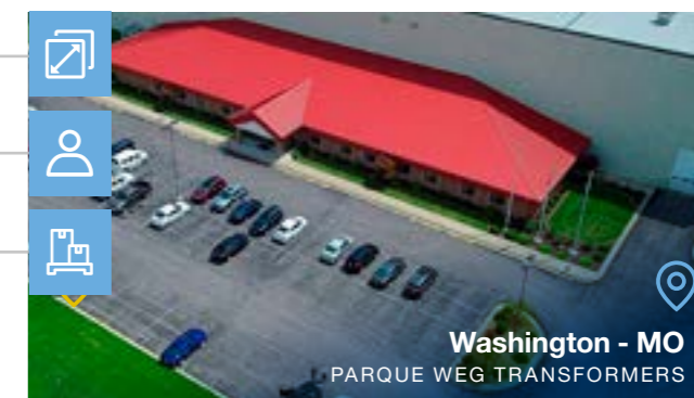
Washington - MO PARQUE WEG TRANSFORMERS