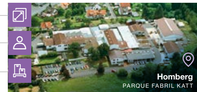
Homberg PARQUE FABRIL KATT

Tipo de negócio: ■ Inversores para aplicações industriais ■ Inversores para elevadores ■ Servodrives ■ Drives CC ■ Fornecedores de energia Regen e CA/CC ■ Centro de treinamento do cliente ■ Serviço