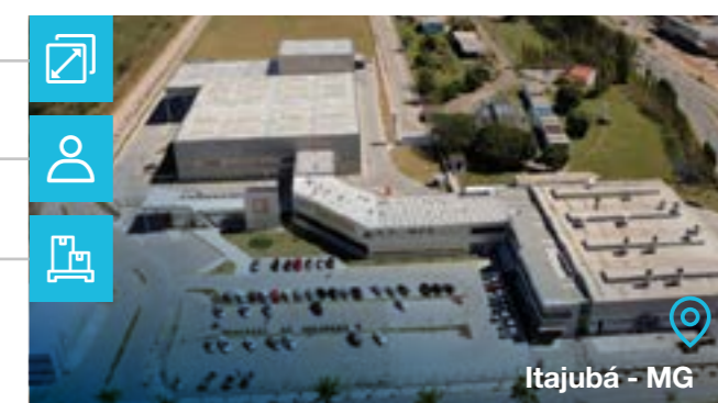
Itajubá - MG

Tipo de negócio: ■ Turbinas a Vapor ■ Redutores ■ Serviços