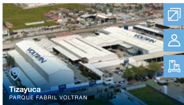
Tizayuca PARQUE FABRIL VOLTRAN

Tipo de negócio: ■ Motores Elétricos BT e AT ■ Geradores ■ Painéis ■ Transformadores ■ Transformadores de Potência ■ Subestações