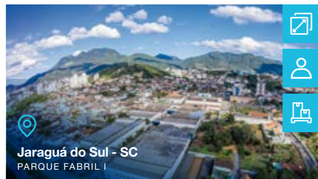
Jaraguá do Sul - SC PARQUE FABRIL I