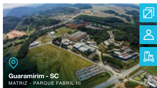
Guaramirim - SC MATRIZ - PARQUE FABRIL III

Tipo de negócio: Motores Elétricos Drives & Controls BT e AT, Síncronos e de Corrente Contínua Painéis Cubículos Geradores Serviços Aerogeradores