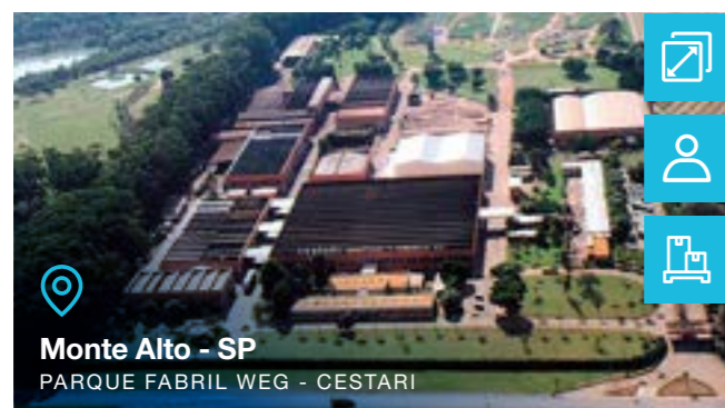
Monte Alto - SP PARQUE FABRIL WEG - CESTARI