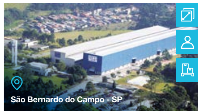
São Bernardo do Campo - SP