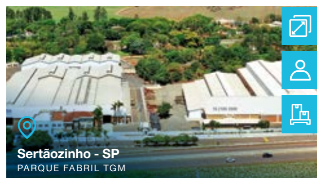
Sertãozinho - SP PARQUE FABRIL TGM