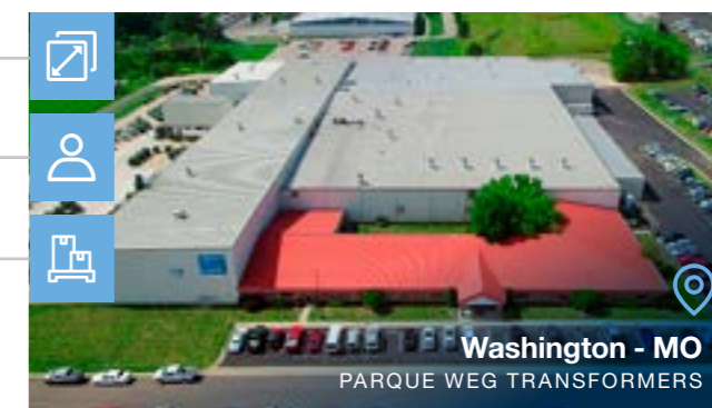
Washington - MO PARQUE WEG TRANSFORMERS