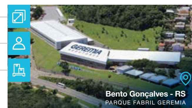
Bento Gonçalves - RS PARQUE FABRIL GEREMIA

Tipo de negócio: Redutores Componentes para Transmissão Mecânica Motorreductores Multiplicadores de Velocidade