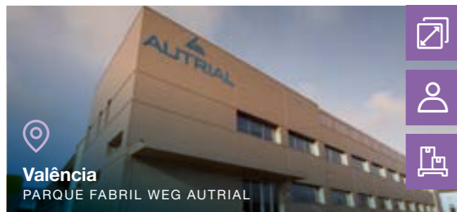
Valência PARQUE FABRIL WEG AUTRIAL

9.685 m 2 7.116 m 2 Área total Área construída 133 Colaboradores Tipo de negócio: Painéis Elétricos