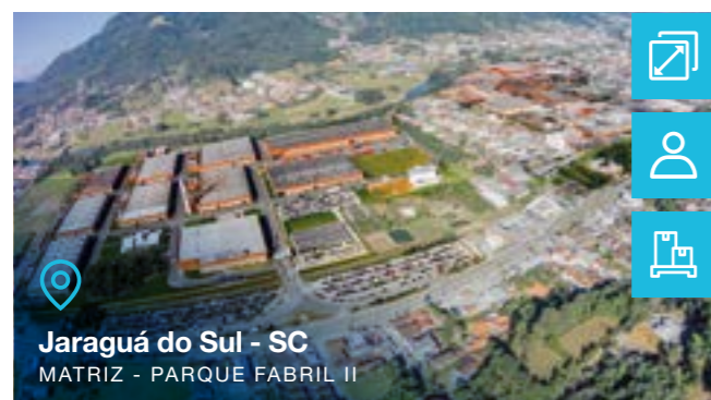
Jaraguá do Sul - SC MATRIZ - PARQUE FABRIL II

Tipo de negócio: Capacitores Centro WEG Centro de Treinamento de Clientes Ferramentaria Tomadas & Interruptores