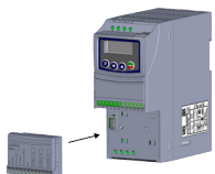
(b) Accessory connection (b) Conexión del accesorio (b) Conexão do acessório