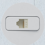
Red de Datos

Funcionales y versátiles, los módulos garantizan flexibilidad y practicidad en la instalación, permitiendo innumerables combinaciones en el mismo tomacorriente. Los contactos de los interruptores, producidos con aleación de cobre y plata, garantizan durabilidad y vida útil más larga del producto.