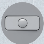
Sensor de Presencia