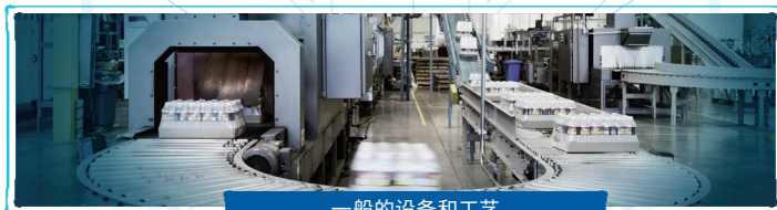
一般的设备和工艺